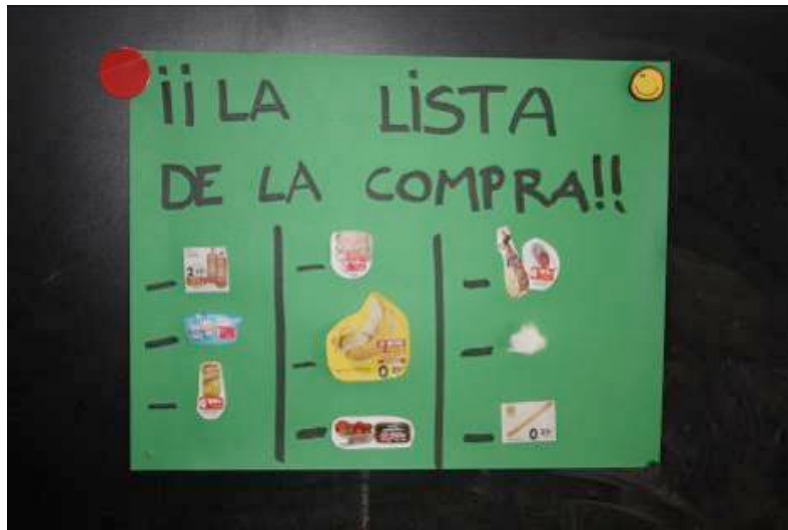
Fotografía 10. Alumna manipulando revistas para la “lista de la compra”