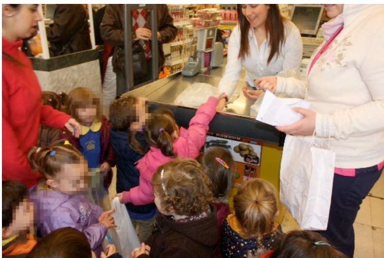
Fotografía 12. Alumnado en el supermercado