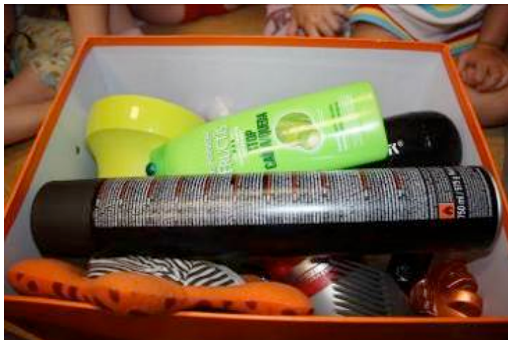
Fotografía 1. Momento de apertura de la caja de peluquería