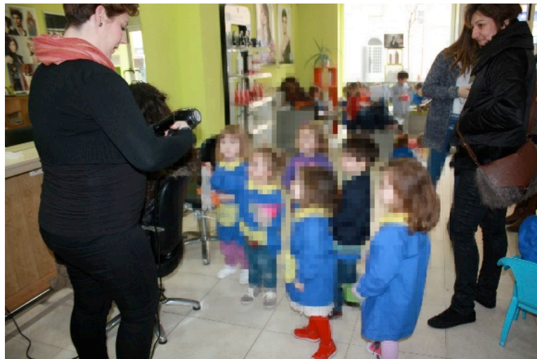
Fotografía 4. Explicación lavacabezas