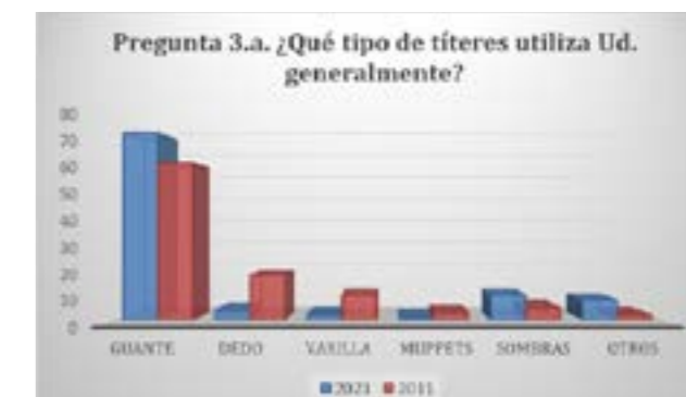
Figura 2. Tipos de títere utilizados

interesante sea la comparación con las respuestas a la misma pregunta en 2011: