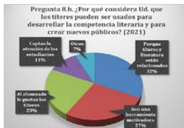
Figura 6. Los títeres y la competencia literaria.

La pregunta genérica de si los títeres pueden servir para desarrollar la competencia literaria es contestada afirmativamente por el 97% de los docentes. A la pregunta sobre las causas de esta utilidad en la educación literaria, se obtienen las siguientes respuestas: