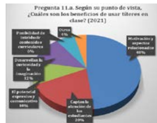
Figura 8. Beneficios de los títeres

Por lo que se refiere a la frecuencia, cabe destacar, entre quienes declaran que sus alumnos ven espectáculos de títeres, el amplio 27% que lo hace con una periodicidad menor que una vez al año. La mayoría de las personas que respondieron (51%) declararon que el alumnado asiste a un espectáculo de títeres cada curso, un 18% dos o tres veces; y sólo un 4% más de tres veces al curso. Los porcentajes son, en general, similares a los de 2011.