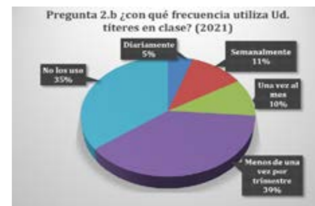
Figura 1. Frecuencia de uso de los títeres

Por lo que se refiere a los tipos de títere que se utilizan, los de guante son con diferencia los más usados, con un porcentaje del 75%, seguido de lejos