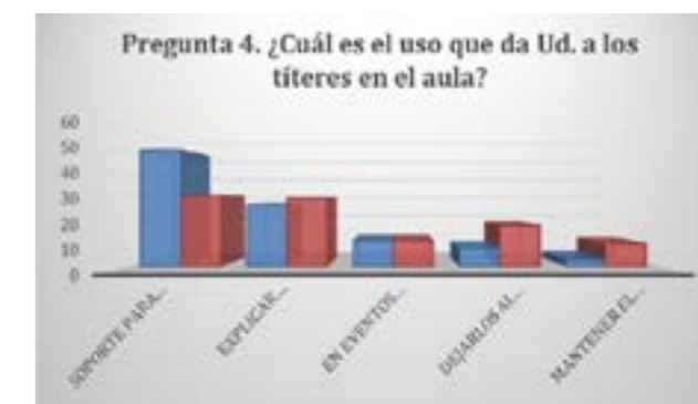
Figura 3. Uso de los títeres

En relación a las causas de la elección de un determinado tipo de títere en detrimento de otros, un 40% de las respuestas afirman que son asequibles, que son los que existen en el centro o que son los que proporciona la administración educativa correspondiente; otro 40% considera que son más fáciles y cómodos de usar, un 15% piensa que se adapta a las necesidades del alumnado y un 5% declara que los elige por preferencia personal. Al igual que en las respuestas a la pregunta anterior, seguimos encontrando una cierta pasividad de los docentes en cuanto a elección de las herramientas de trabajo en el aula. Asimismo, debemos decir que en esta cuestión el porcentaje de respuestas en blanco alcanza el 55% del total, mientras que en 2011 el porcentaje fue del 35%. Por lo demás, y con algunas variaciones, las respuestas son bastante similares a las de 2011.