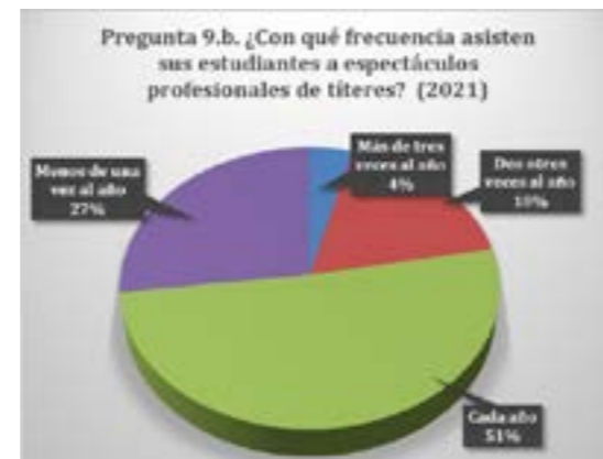
Figura 7. Asistencia a espectáculos de títeres

En cuanto a la asistencia del alumnado a espectáculos de títeres, una amplia mayoría (más del 70%) afirma que sus alumnos ven alguna vez títeres (seis puntos por debajo del resultado de 2011), frente al 30% que reconocen que no lo hacen (seis puntos más que en 2011).