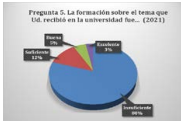
Figura 4. Percepción de la propia formación universitaria