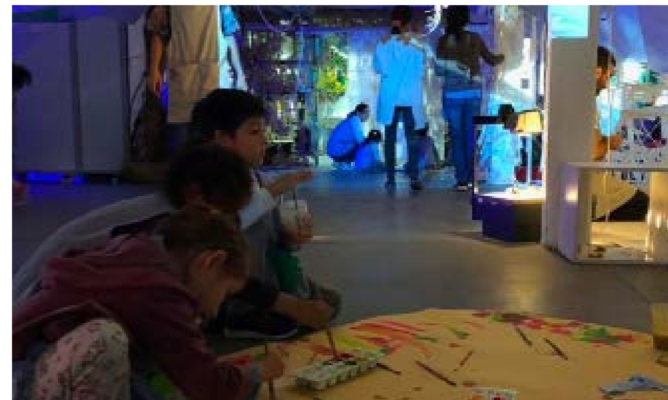
Figura 2. Espacio de Atelier 2019 Centro ReMida Buenos Aires