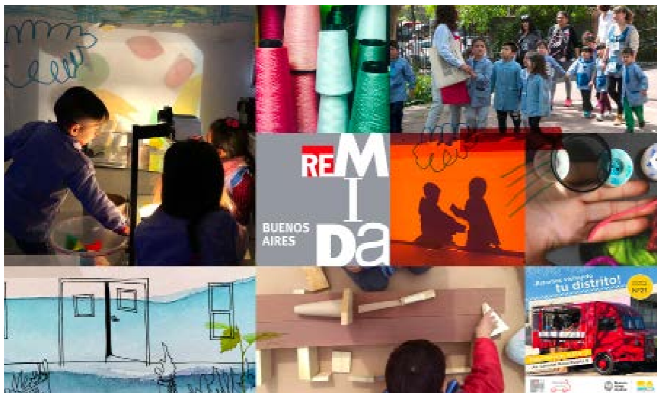
Fuente: Centro ReMida Buenos Aires Figura 1. Presentación ReMida Buenos Aires 2024 Centro ReMida Buenos Aires.