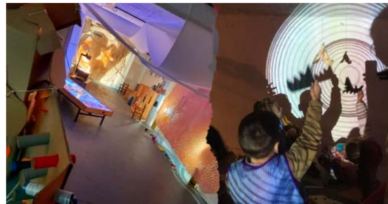
Figura 4. Atelier Oniria 2022 Centro ReMida Buenos Aires

ofreciéndose como recurso educativo, escapando así a la definición de inútil y desperdicio.