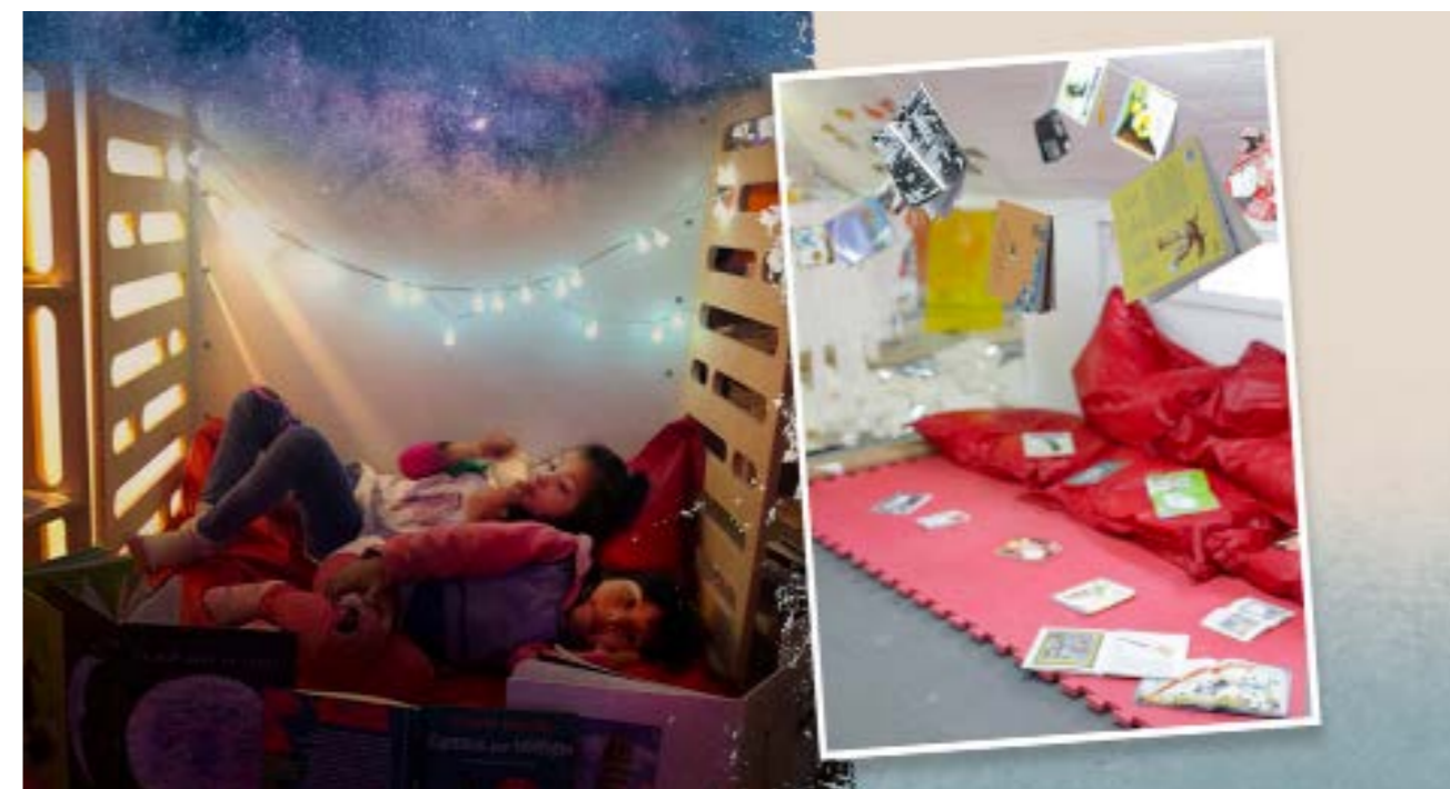
Figura 7. Atelier 2019 y Oniria 2022 Centro ReMida Buenos Aires