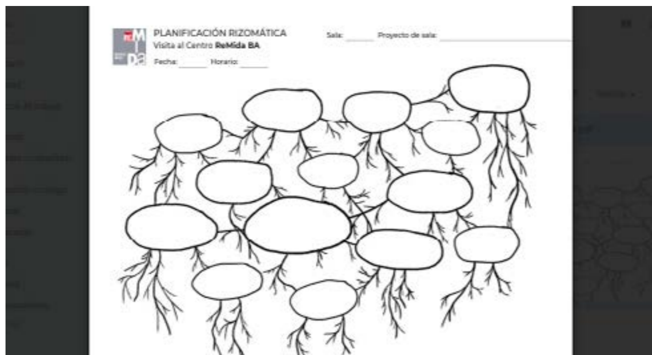
Figura 9. Plantilla de trabajo sobre Imagen Rizomática